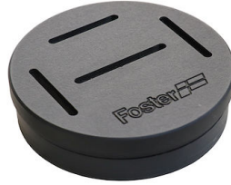
Messerständer 8100 030