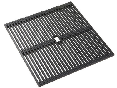
Schwarze Gitter Milanello 8100 602